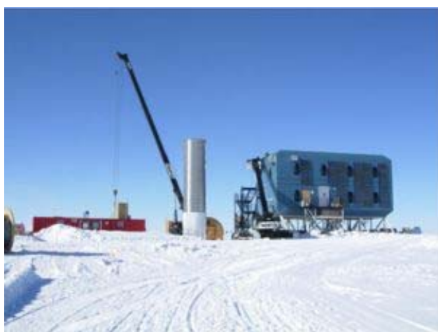
الشكل (4). جزء من تلسكوب أماندا.