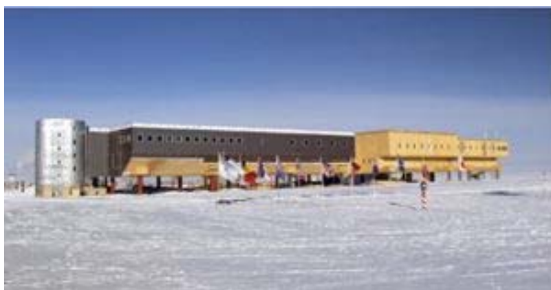
الشكل (3). محطة أموندسن- سكوت.